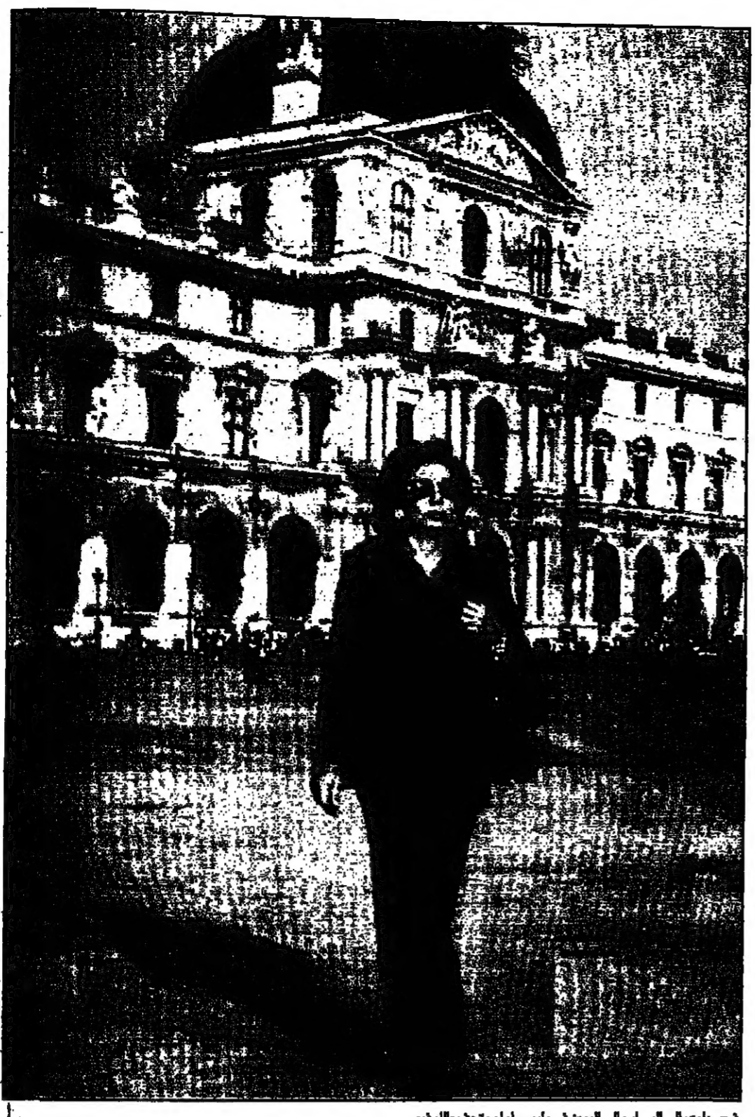
فرح بهلوي في القصر والي البيت في باريس أمام متحف اللوفر

باريس - القدس العربي: منذ عشرون عاما تعيش الامبراطورة فرح بهلوي في المنفى. لم اربعة اولاد وجمعة لطفلين، ما تزال تحمل وتسامل العودة الى بلدها. في عام 1978 سقط العرش الشاهنشاهي والى غير رجعة، وعلى اثر تلك الثورة كما هو معروف رحل الشاه وعاشته عن طهران. فقد جمعت هذه الثورة للجد من انفسه فكانت زوجة باقوى رجل في العالم آنذاك، ولعل القدر جعل حياتها زوجة باقوى رجل في العالم آنذاك، ولعل القدر جعلها تعيش في الامبراطورة المنفية بين باريس حيث تعيش والنها. وبين الولايات المتحدة حيث يقبل اولادها، لكنها لا تتردد في العودة واحدة وهي العيش في ريف ايران - حوران ساخن تتحدث فيه الامبراطورة فرح عن حياة الاصدقاء، والايمان، والاموال والشايات.